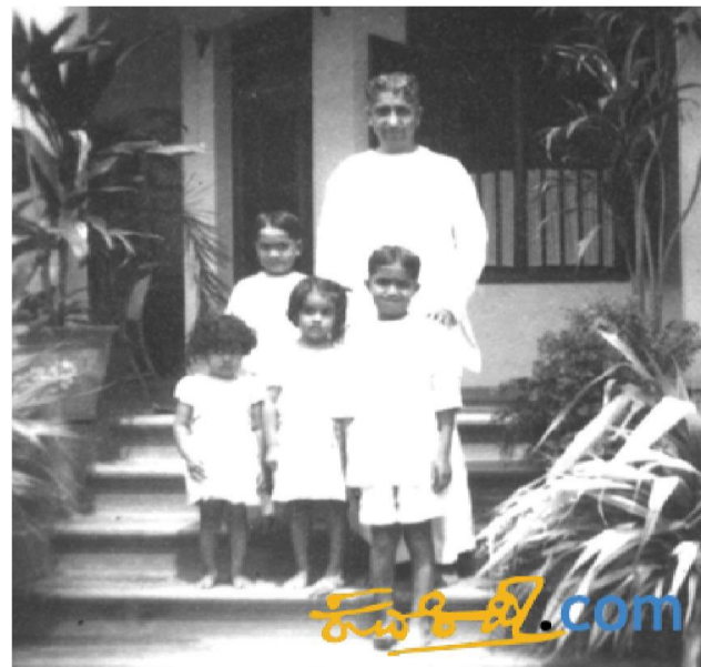
ತಮ್ಮ ಮಕ್ಕಳೊಂದಿಗೆ ಕುವೆಂಪು

ಮಕ್ಕಳ ಮನೋಧರ್ಮವನ್ನು ಚೆನ್ನಾಗಿ ಬಲ್ಲ ಕುವೆಂಪು ತಮ್ಮ ಸಾಹಿತ್ಯಲೋಕದಲ್ಲಿ ಅನೇಕ ಮಕ್ಕಳ ಪಾತ್ರಗಳನ್ನು ಚಿತ್ರಿಸಿದ್ದಾರೆ. ಕಾಡು, ಧರ್ಮು, ವಾಸು, ಪುಟ್ಟಿ ಮುಂತಾದ ಮಕ್ಕಳು ಅವರ ಕಾದಂಬರಿಗಳಲ್ಲಿ ಕಂಡು ಬರುತ್ತಾರೆ. ಕುವೆಂಪು ಮಕ್ಕಳ ವಯೋಮಾನಕ್ಕೆ ತಕ್ಕಂತೆ ಹಲವಾರು ಕವಿತೆಗಳನ್ನು ಬರೆದಿರುತ್ತಾರೆ. ನನ್ನ ಮನೆ (1946), ಮರಿವಿಜ್ಞಾನಿ (1947), ಮೇಘಪುರ (1947) ಇವು ಮೂರೂ ಶಿಶು ಗೀತೆಗಳ ಸಂಗ್ರಹಗಳು. ಅವರ ಮಕ್ಕಳ ಸಾಹಿತ್ಯದಲ್ಲಿ ಕಲ್ಪಕತೆ, ವೈಚಾರಿಕತೆ ಹಾಗೂ ವೈಜ್ಞಾನಿಕ ದೃಷ್ಟಿ ಇವು ಮೂರು ತ್ರಿವೇಣಿ ಸಂಗಮವಾಗಿದ್ದು ಬಹುಬೇಗ ಮಕ್ಕಳನ್ನು ತನ್ನತ್ತ ಸೆಳೆಯುತ್ತವೆ.